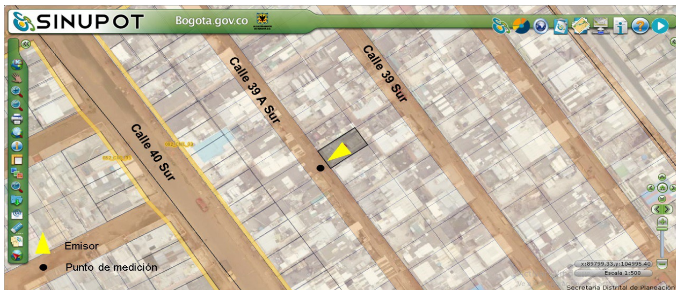
Figura 1. Ubicación del predio emisor y punto de medición.

Nota 4: Datos suministrados en el Anexo No 5. Reporte SINUPOT.